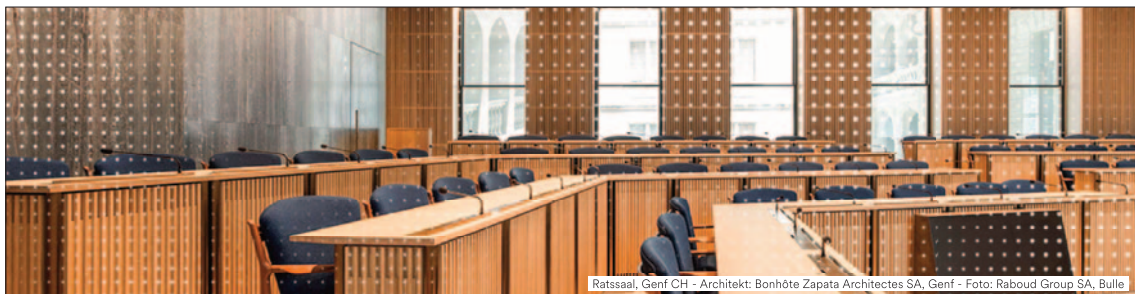
Ratssaal, Genf CH - Architekt: Bonhôte Zapata Architectes SA, Genf - Foto: Raboud Group SA, Bulle

Topakustik ist eine weltweit aktive Marke und Hersteller von schallabsorbierenden Decken- und Wandsystemen aus Holzwerkstoffen. Die Elemente werden auf verschiedenen Anlagen nach den Vorstellungen unserer anspruchsvollen Kunden in Lungern OW produziert. Zur Ergänzung unseres Teams suchen wir dich als